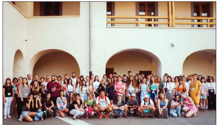
A II. Felczak Diáktábor résztvevői